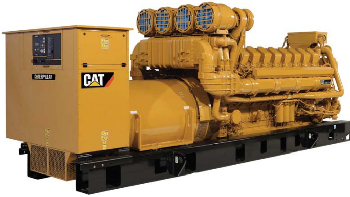
所示图片可能未反映实际的机器